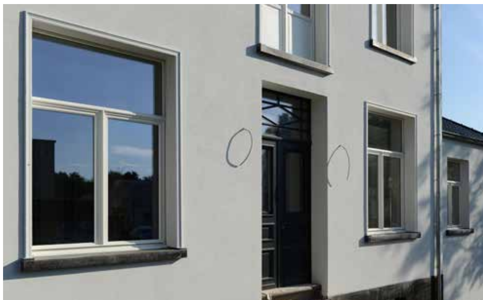
Rénovation maison à Malines.

Nos systèmes d'isolation de façades sont perméables à la vapeur d'eau. Il est donc important de choisir une peinture offrant une perméabilité maximale.